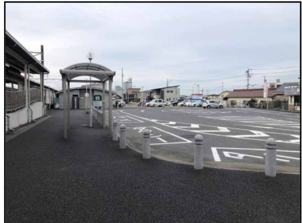
駅出口から左を見た画像です。タクシー乗り場付近に停車します。