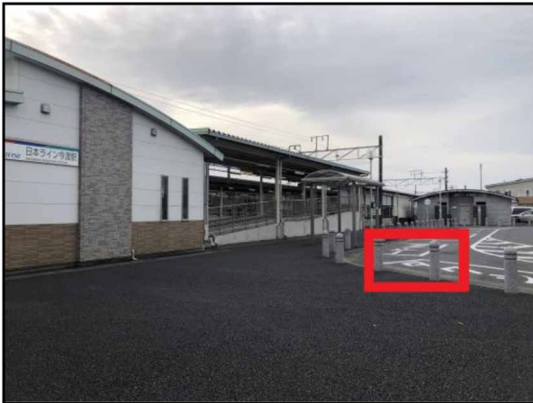
道路側から見た画像です。赤枠付近に停車します。