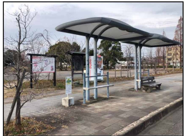
こちらの雨よけ付近にバスが停車します。