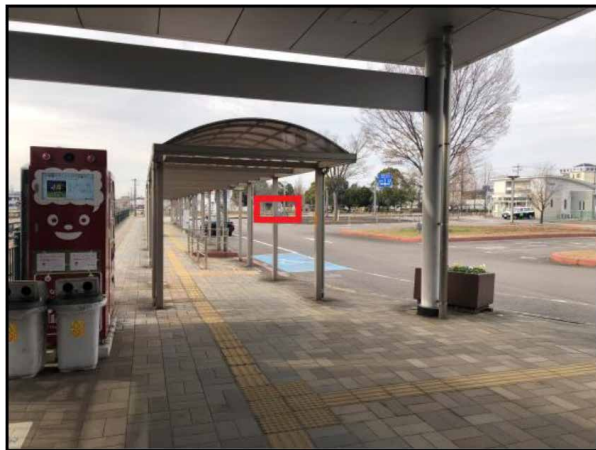
駅出口から見た画像です。赤枠付近にお越しください。